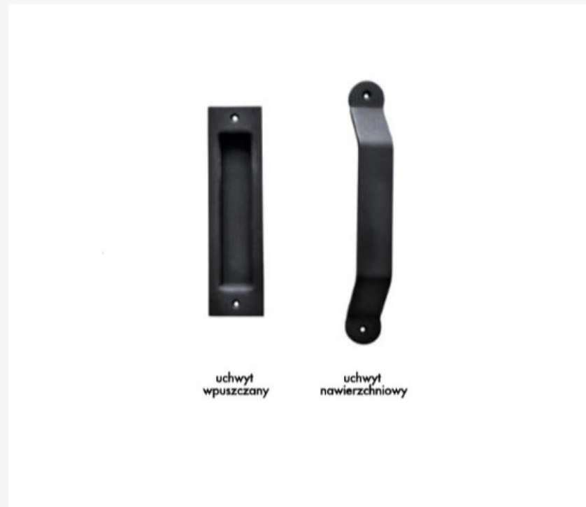
Uchwyty REA - do drzwi przesuwnych - skrzydła drewniane