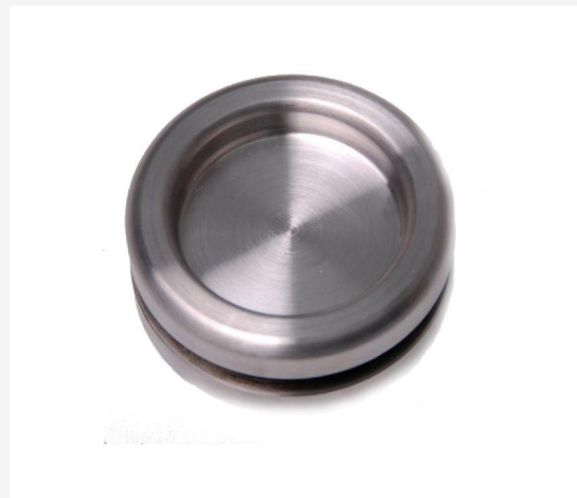
Uchwyt okrągły CD20 do drzwi przesuwnych - tafla szklana