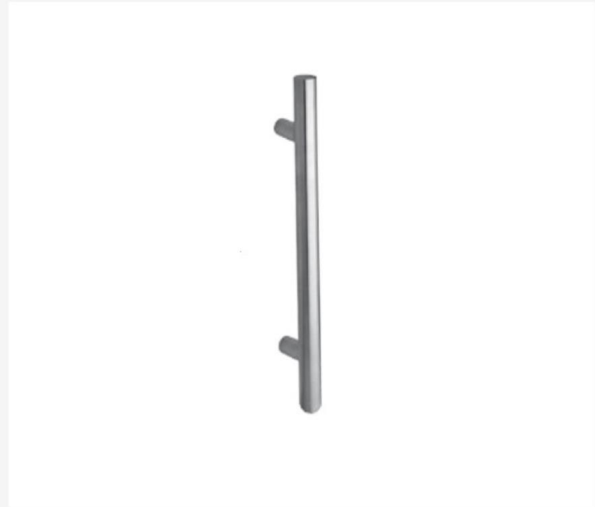
Reling prosty 460 mm do drzwi przesuwnych - tafla szklana