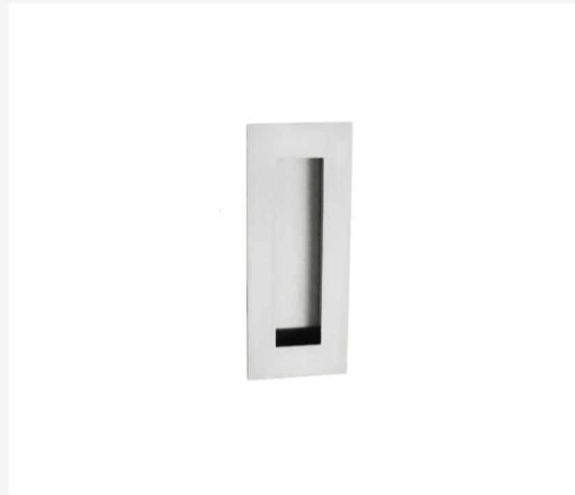
Uchwyt z otworem 55x135 mm - do drzwi przesuwnych - skrzydła drewniane