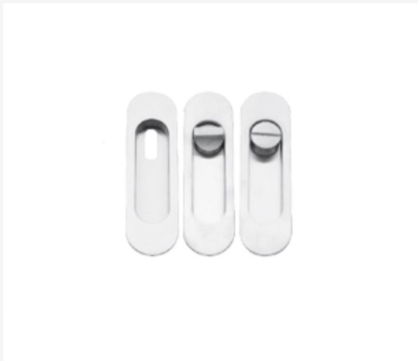
Uchwyty podłużne do drzwi przesuwnych - skrzydła drewniane