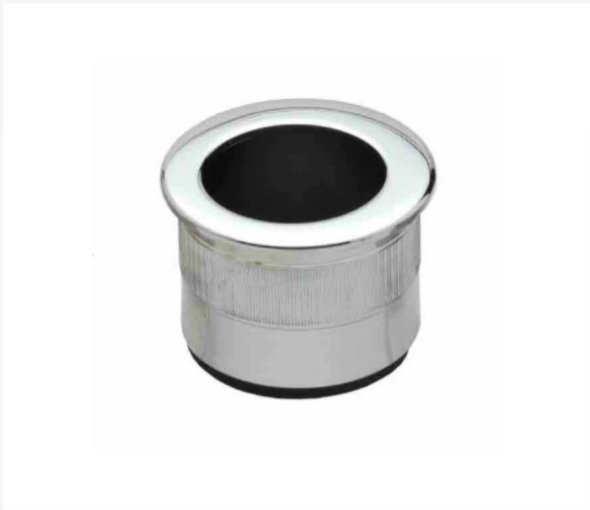
Uchwyt palcowy do drzwi przesuwnych - skrzydła drewniane